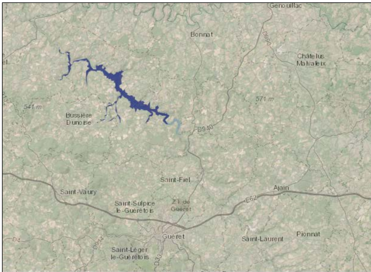
Figure 2 : Localisation du site Natura 2000 « Gorges de la Grande Creuse »